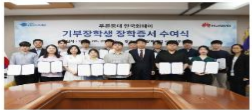
[보도자료] 한국장학재단 한국화웨이 장학금 장학증서 수여식