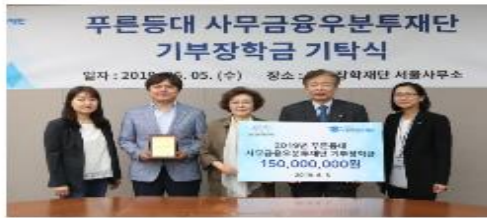
[보도자료] 한국장학재단 사무금융우분투재단 장학금 기탁식