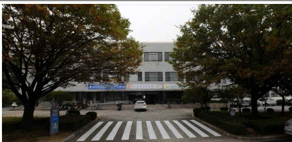
영남대 생산기술연구원 건물 외관