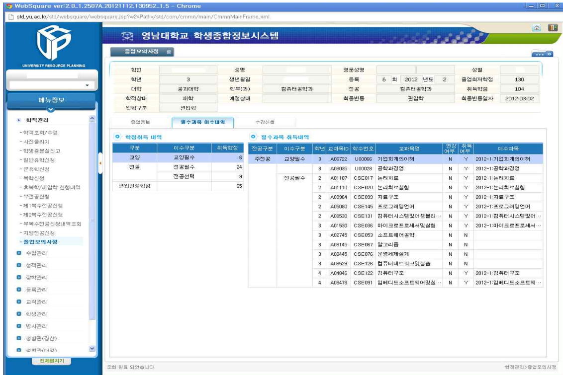
[그림 4-2] 졸업모의사정 필수과목 이수내역 화면